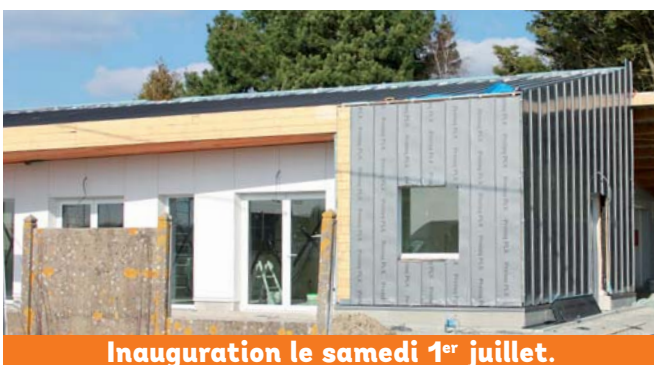
Inauguration le samedi 1 er juillet.

Actuellement, 15 lots individuels ont été vendus sur les 23 de la première tranche, plusieurs autres font l'objet de réservations. Les premiers permis de construire pour ces maisons individuelles ont été déposés, ils sont en cours d'instruction.