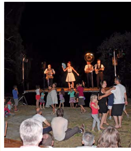
DOSSIER Bon été à La Chevrolière