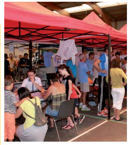
FORUM DES ASSOCIATIONS Samedi 3 septembre

À la une POSE DE LA 1 ère PIERRE NOUVEL HÔTEL DE VILLE