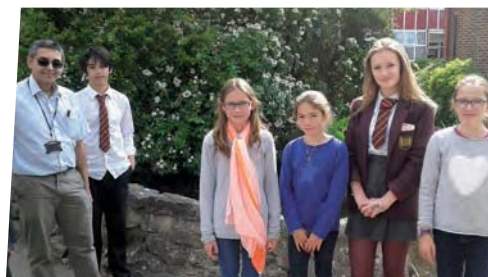
Visite de Romsey School.